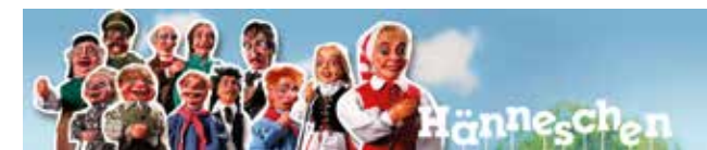
Het Hänneschen Theater, opgericht in 1802, bestaat nog steeds (zie www.haenneschen.de ).

Nooit vertoond. Groot Kölner Hänneschen Theater, niet met poppen, maar met levende personen. WOENSDAG 29 juni 1887 Eerste groote Openings Voorstelling, in de open lucht aan de Keulse Poort. Prijzen: Volwassenen 12 cts.; kinderen betalen de helft. Aanvang 8 1/2 uur. Tot een bezoek noodigt beleeft uit CARL KLEINERTZ, Directeur